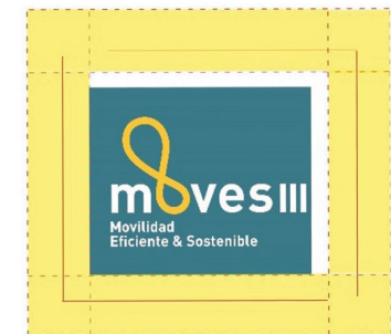
Invasión o reducción del área de seguridad